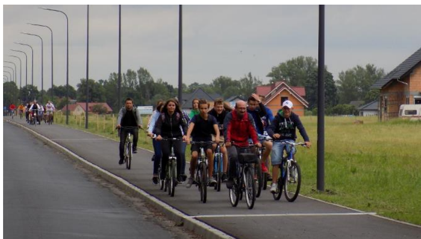
Fot. 1: Ścieżka rowerowa Szprotawa - Malomice