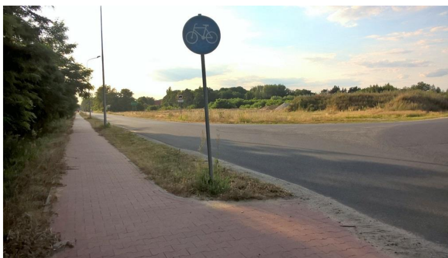
Fot. 4: Wjazd wschodni na drogę rowerową wzdłuż ul. Nowej (Szprotawa-Wiechlice)