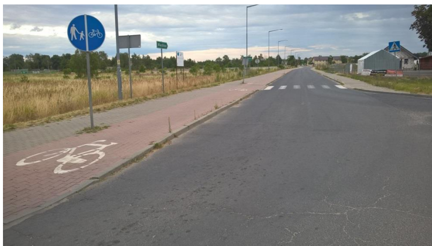
Fot. 3: Wjazd zachodni na drogę rowerową wzdłuż ul. Nowej (Szprotawa-Wiechlice)