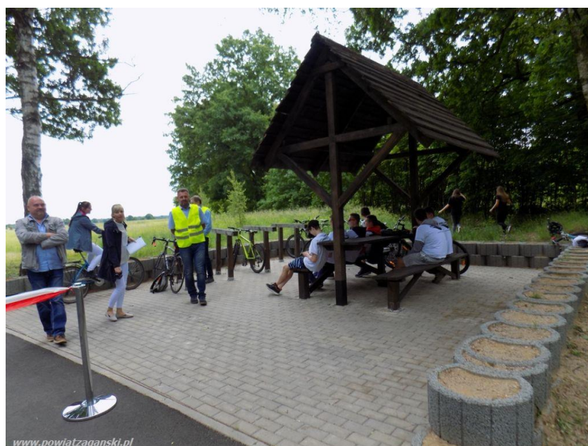
Fot. 2: Punkt odpoczynkowy przy ścieżce rowerowej Szprotawa - Malomice