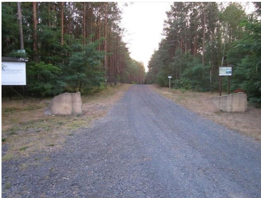
Fot. 7: Pętla Bobrowicka w okolicy dawnej leśniczówki Bobrowice

Powracając jednak do pierwszej grupy (zaspokajanie potrzeb życia codziennego) rejestruje się brak rozwiązań komunikacji rowerowej na terenie miasta. Szprotawa to organizm miejski rozciągnięty równoleżnikowo - na dystansie ok. 5 km, bez dróg i choćby wyznaczonych tras rowerowych, a ruch rowerowy na tym dystansie jak najbardziej istnieje. Stąd wynika priorytetowa potrzeba stworzenia rozwiązania dla komunikacji rowerowej w samym mieście . Wprowadzenie takiego rozwiązania dałoby dodatkową korzyść w postaci skomunikowania (połączenia) drogi rowerowej Szprotawa-Małomice z drogą rowerową Szprotawa-Wiechlice (Lotnisko) oraz z utwardzonym poboczem Szprotawa-Cieciszów. W ślad za drogami rowerowymi powinna też iść zwiększona ilość miejsc parkingowych dla rowerów. Zupełnie na marginesie należy wspomnieć niedawną nieudaną próbę takiego skomunikowania w postaci wydzielenia pasów ruchu dla rowerów z istniejących chodników oraz alejek parkowych, co w rezultacie jednak kolidowało z przepisami Prawa o ruchu drogowym.