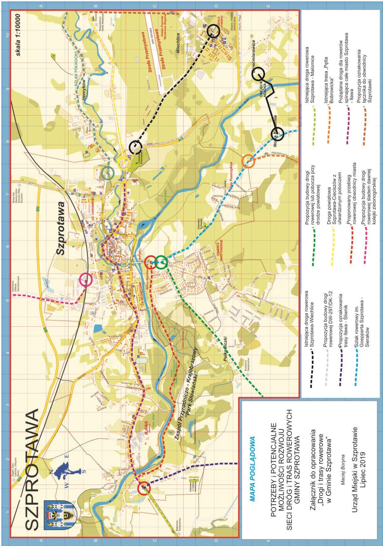
Mapa 4: Potrzeby i potencjalne możliwości rozwoju sieci dróg i tras rowerowych Gminy Szprotawa