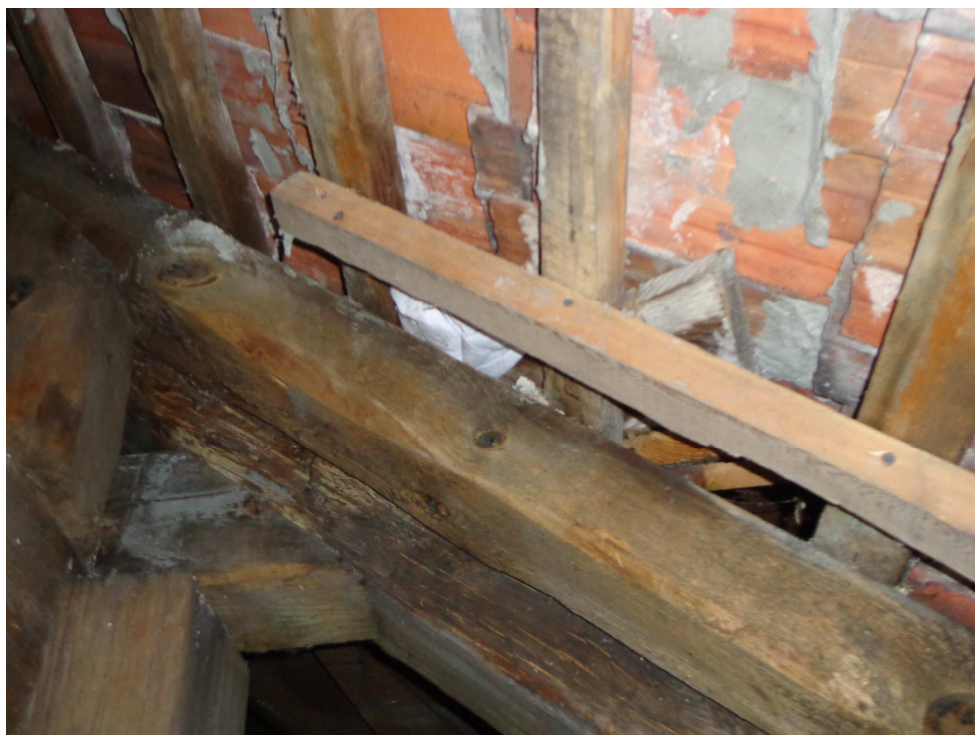
Prowizoryczne uszczelnianie pokrycia, więźba dachowa uszkodzona poprzez degradację biologiczną.