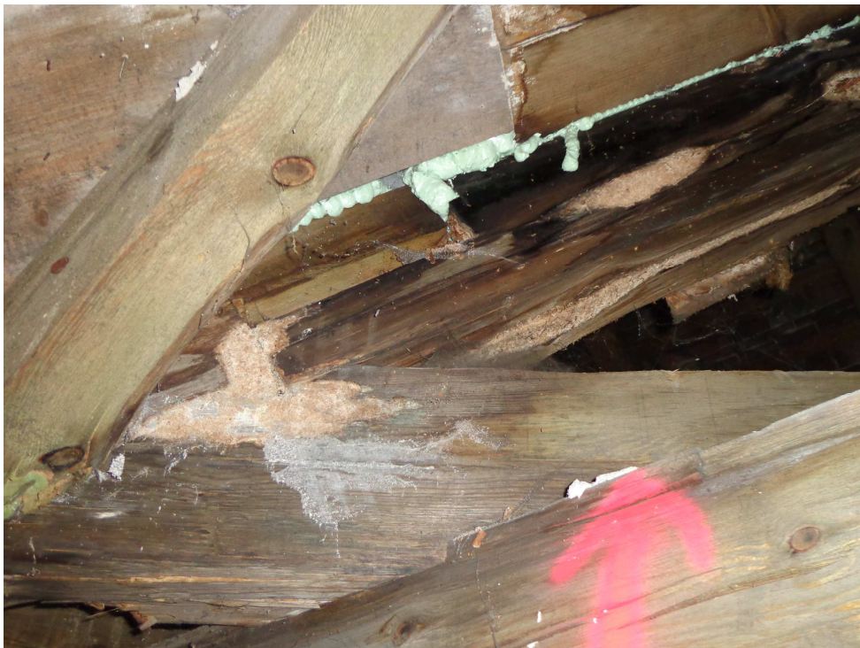
Prowizoryczne uszczelnianie pokrycia, więźba dachowa uszkodzona poprzez degradację biologiczną.