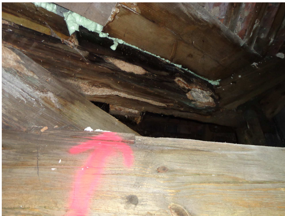
Prowizoryczne uszczelnianie pokrycia, więźba dachowa uszkodzona poprzez degradację biologiczną.