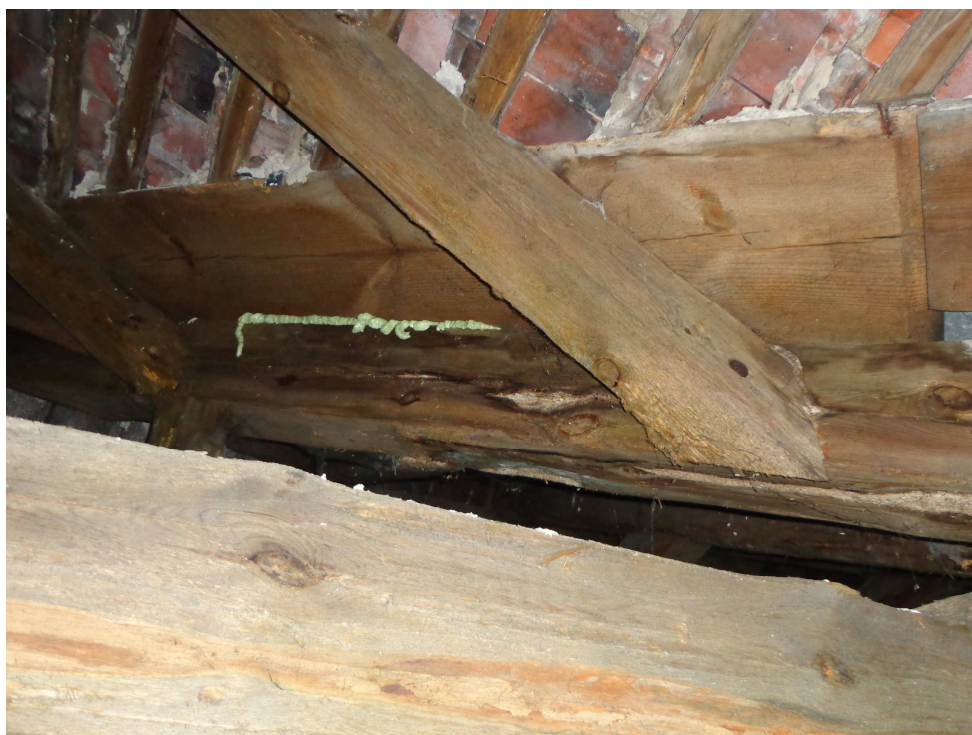
Prowizoryczne uszczelnianie pokrycia, więźba dachowa uszkodzona poprzez degradację biologiczną.