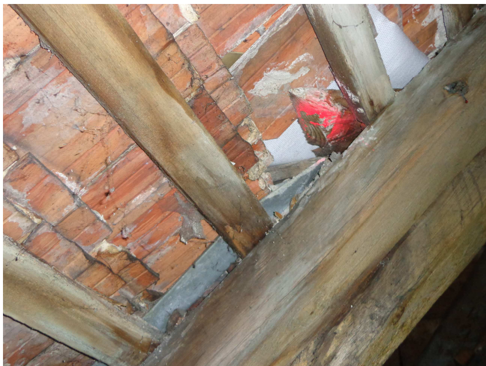
Prowizoryczne uszczelnianie pokrycia, więźba dachowa uszkodzona poprzez degradację biologiczną.