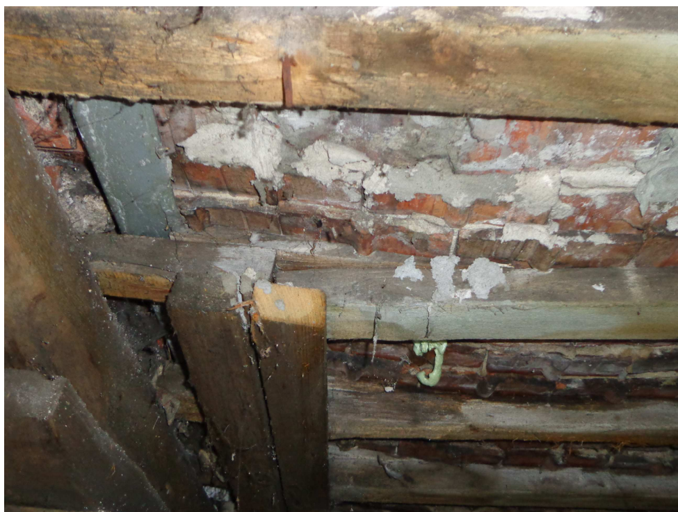
Prowizoryczne uszczelnianie pokrycia, więźba dachowa uszkodzona poprzez degradację biologiczną.