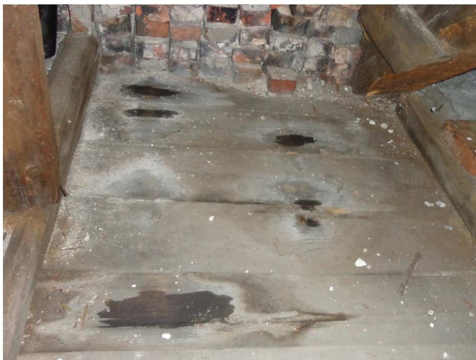
Nieszczelności pokrycia powodują zalewanie budynku.