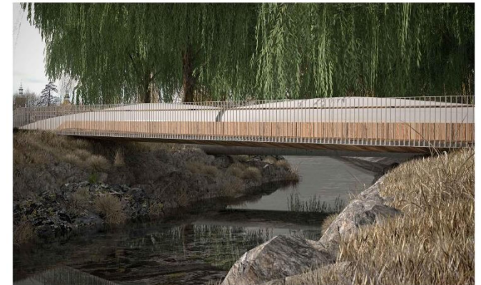
PROJEKT KONCEPCYJNY KŁADKI NA RZECIE SZPROTAWA